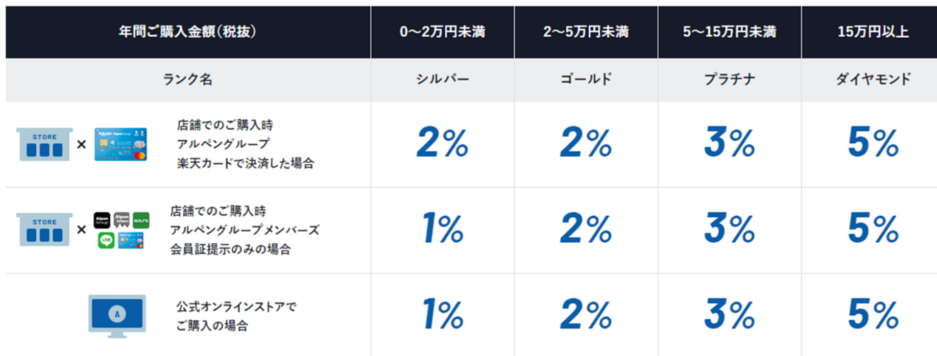
会員ランクとポイント付与率